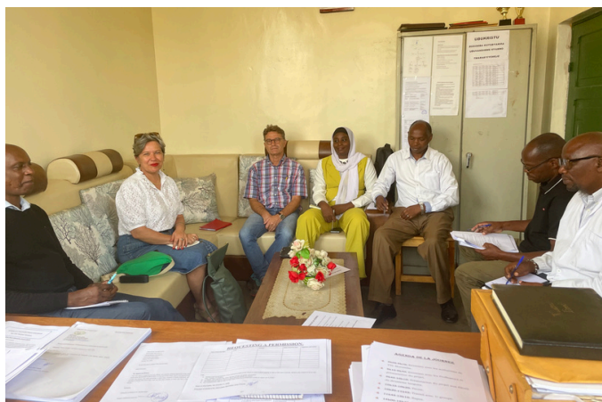
Réunion dans le bureau du directeur